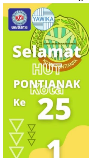
Gambar 4. Contoh Hasil Canva Peserta

Selain peserta juga antusias terhadap materi yang disampaikan yang berkaitan dengan tema kegiatan pelatihan pembuatan reel Instagram menggunakan aplikasi Camva. Tujuan utama dalam kegiatan ini yaitu memberikan literasi baru terhadap peserta kegiatan pengabdian kepada masyarakat yaitu dapat menggunakan aplikasi canva untuk membuat konten reel Instagram yang berfungsi sebagai media informasi.