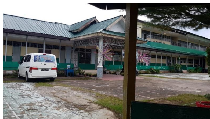
Gambar 2. Tahapan Survei Lokasi dan Identifikasi Masalah

Pelaksanaan kegiatan pengabdian kepada masyarakat yang dilaksanakan pada Yayasan YAWIKA diawali dengan melakukan ijin dan survei yang dilakukan oleh ketua kelompok dan peserta lain bertemu dengan ketua Yayasan Yayasan YAWIKA Kota Pontianak. Tahapan tersebut juga dilakukan identifikasi permasalahan secara langsung menggunakan metode interview dengan narasumber ketua yayasan.