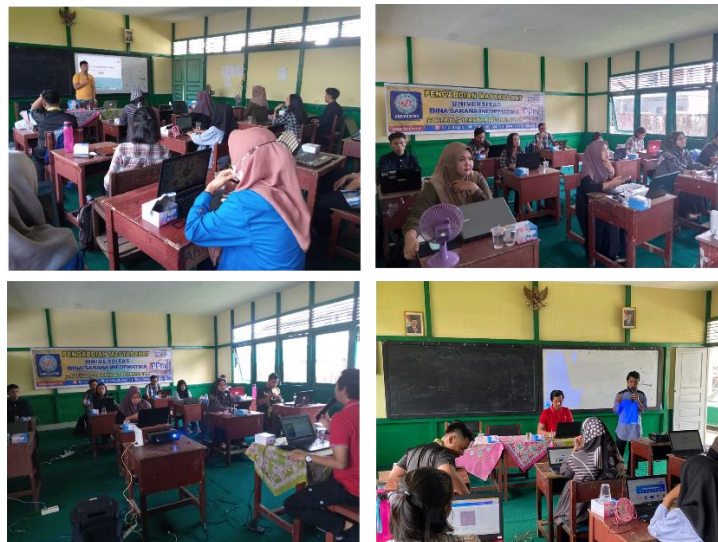
Gambar 3. Tahapan Penyampaian Materi

Tahapan selanjutnya yang diikuti peserta dari pengurus Yayasan YAWIKA Kota Pontianak diikuti dengan antusias, hal tersebut dapat dibuktikan dengan hasil dokumentasi kegiatan penyampaian materi serta hasil pengisian kuesioner yang dilakukan oleh peserta kegiatan pengabdian masyarakat. Tahap pelaksanaan berjalan sesuai dengan rencana kegiatan yang dirumuskan. Pelaksanaan dilakukan dengan menyampaikan presentasi materi kemudian dilanjutkan dengan praktik yang dilakukan oleh peserta. Pada tahap ini mitra Yayasan YAWIKA Kota Pontianak berperan memfasilitasi sebagai tempat kegiatan dan menghadirkan peserta.