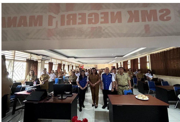
Gambar 3. Foto Bersama Guru-Guru Yang Mengikuti Secara Luring